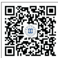
民大官方微信公众号