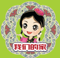
敲起（铁壳鼓），吹起苏尔奈伊（唢呐）

古尔邦节这一天清晨的礼拜，是一年中规模最大的一次礼拜，所有成年男人皆去当地礼拜寺参加聚礼，场面蔚为壮观。在新疆，著名的喀什艾提尕尔清真大寺前的大聚礼结束后，乐师们会登上艾提尕尔清真大寺的门顶，敲起纳格拉（铁壳鼓），吹起苏尔奈伊（唢呐），大寺前广场上的男子们会适时跳起热烈奔放的萨玛舞，以表达喜庆之情。